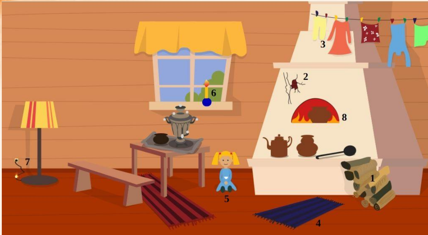
Рис. 1 Проверь найденные нарушения пожарной безопасности в доме