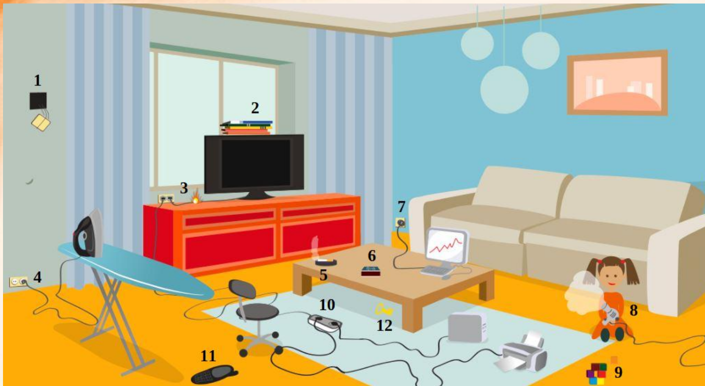
Рис. 3 Проверь найденные нарушения пожарной безопасности в гостиной