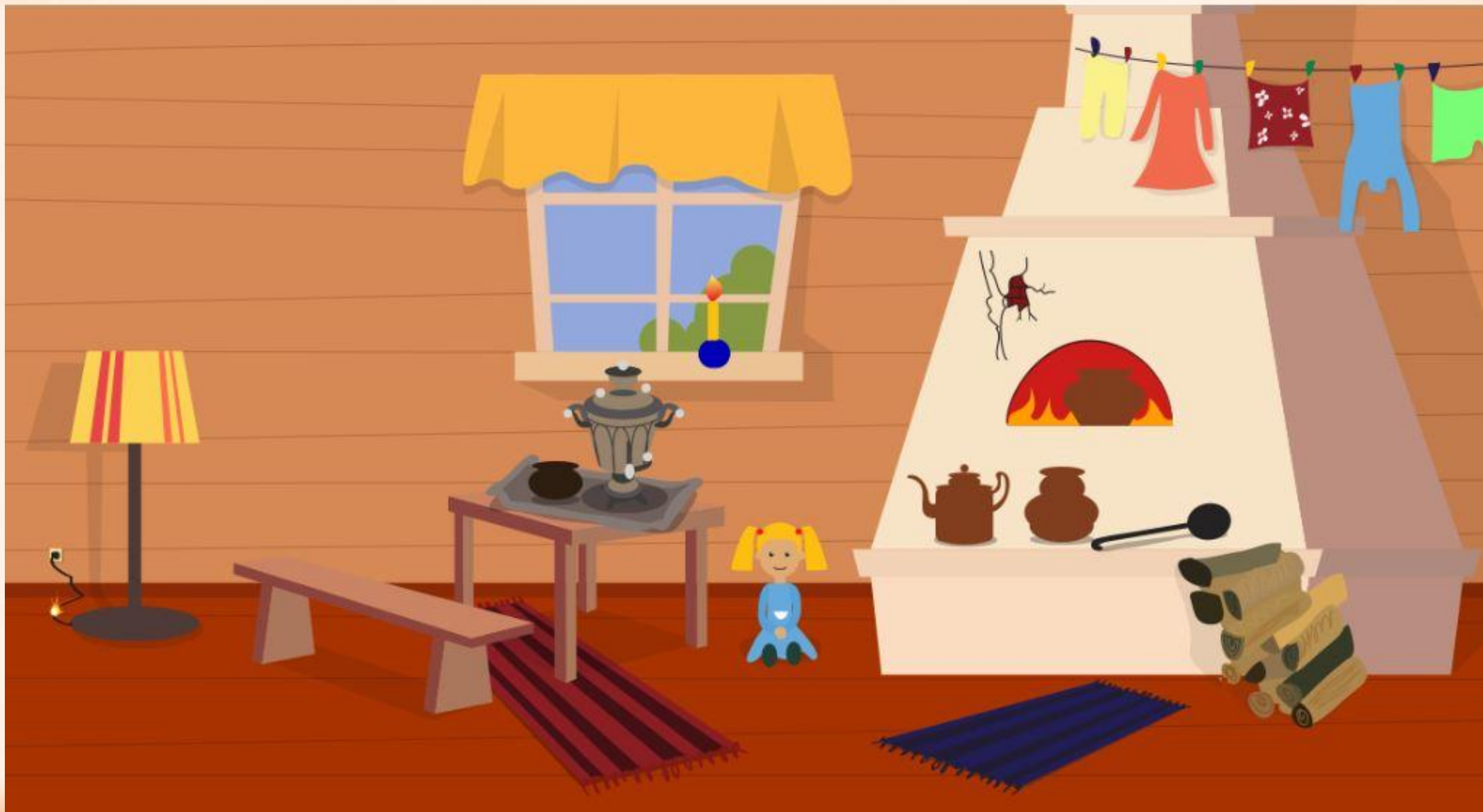
Рис. 1 Найди нарушения пожарной безопасности в доме (8 нарушений)