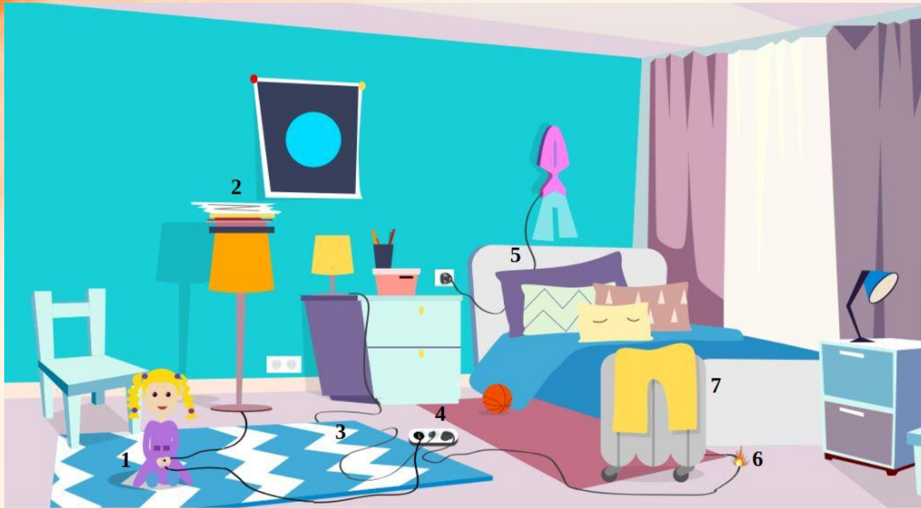
Рис. 5 Проверь найденные нарушения пожарной безопасности в детской