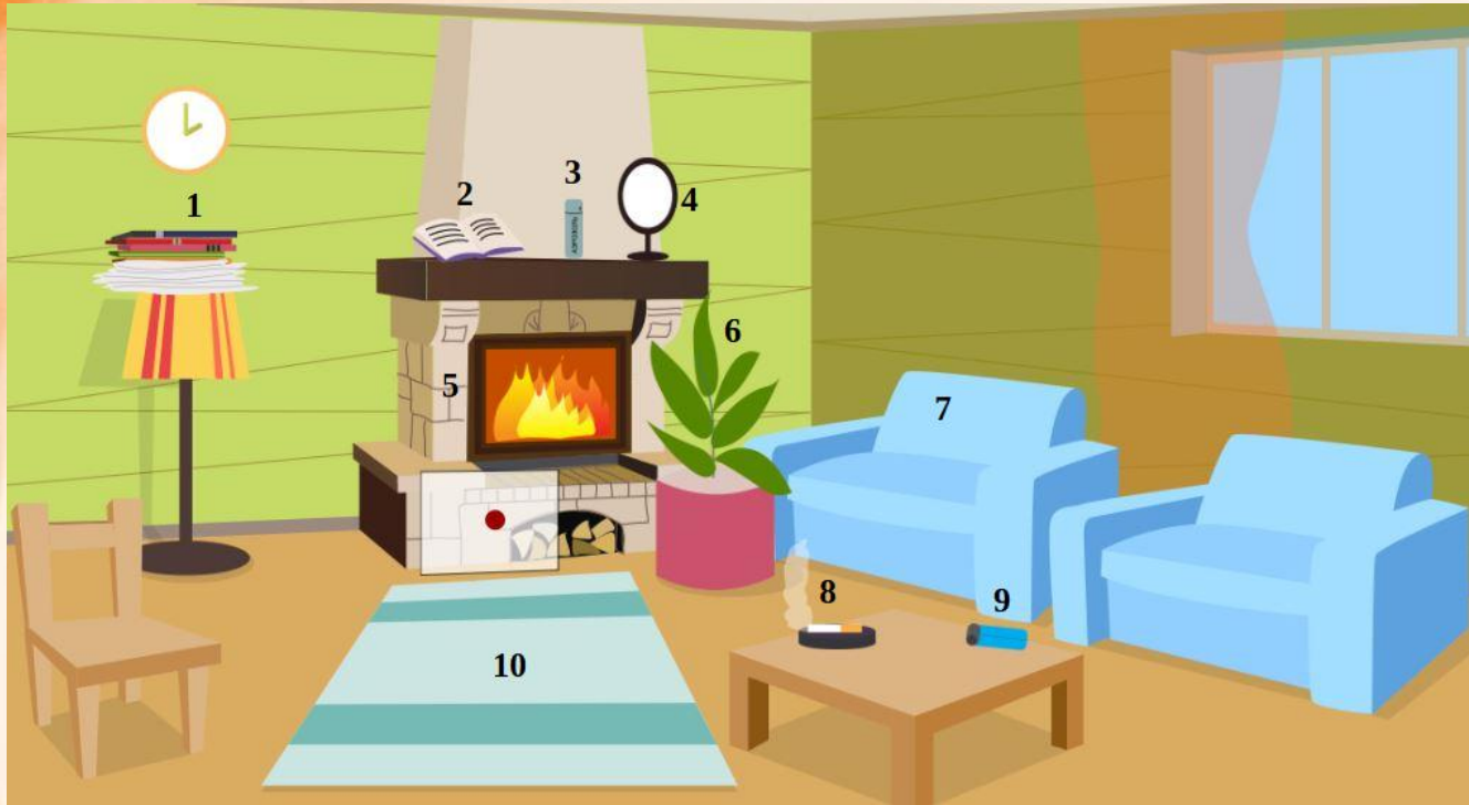
Рис. 4 Проверь найденные нарушения пожарной безопасности в гостиной